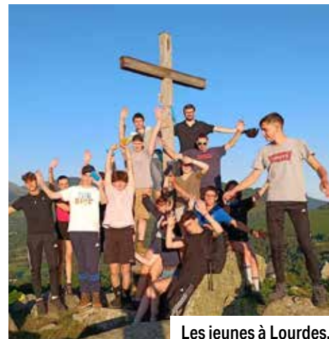
Les jeunes à Lourdes.