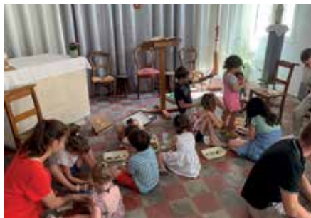
Les enfants, encadrés par des bénévoles, font un bricolage sur le thème de la croix.

De la louange, du partage sur un texte d'Évangile, des témoignages, un temps de