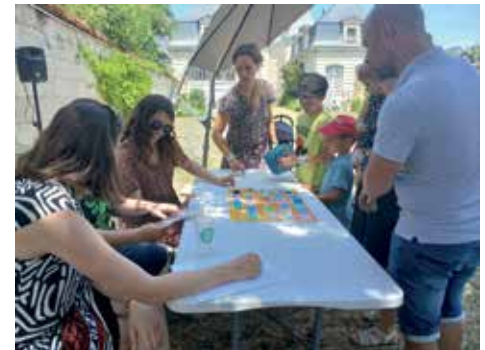
Un grand jeu permet de s'amuser et d'apprendre en famille.

La liste des réalisations du PAM en 3 ans est déjà belle. Nous vous en présenterons d'autres dans les prochains numéros.