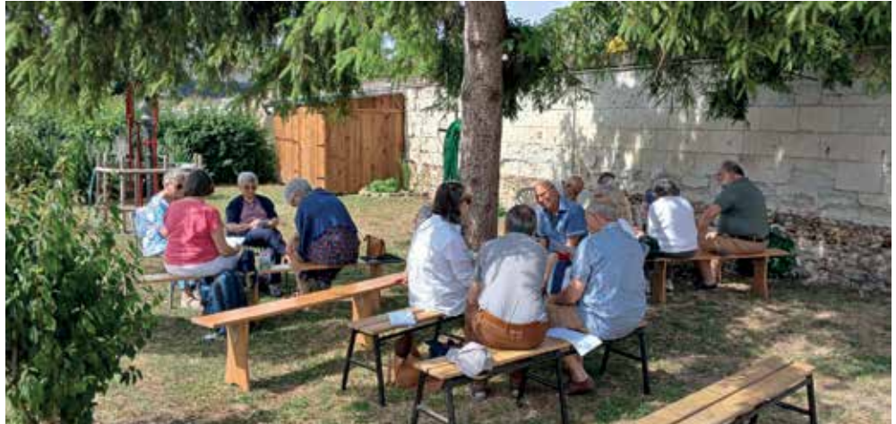
Temps d'échanges entre paroissiens pour faire grandir sa foi et ses engagements.

Le PAM permet l'entraide, le partage de moyens et des formations en commun. Il peut regrouper les personnes engagées dans les mêmes services des différentes paroisses pour un échange d'expériences et d'idées de collaboration future. Nous apprenons à nous connaître et à nous entraider au sein des différentes équipes. La mise en route ne se fait pas en un jour. Quand on décide de collaborer, cela prend du temps ; il faut s'approprier, connaître les forces, les ressources de chacun et les utiliser au mieux. Bref, le PAM est encore en rodage.